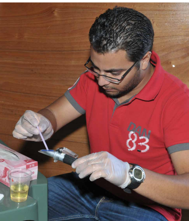
Een DAN Europe researcher controleert de densiteit van urine tijdens een DAN research evenement. Deze test bepaald het soortelijk gewicht van urine, welke afhankelijk is van het hydratatie niveau van de duiker

Het gemakkelijkst om te doen is echter voldoende water drinken. Maar we willen het plasmavolume ook niet te snel vergroten aangezien dit alleen maar de urineproductie zal vergroten in plaats van de lichaamsweefsels te rehydrateren. Drink daarom iedere 15-20 minuten een glas water. Dit stelt de weefsels in staat om gehydrateerd te worden en daarmee wordt de verminderde gasuitwisseling, die kan leiden tot belvorming en DCZ, vermeden.